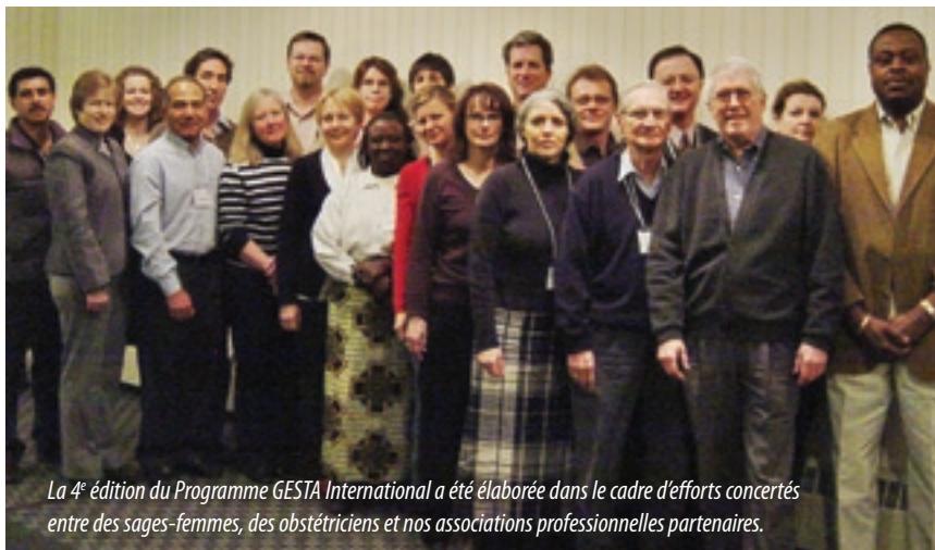
La 4 e édition du Programme GESTA International a été élaborée dans le cadre d'efforts concertés entre des sages-femmes, des obstétriciens et nos associations professionnelles partenaires.

Le programme GESTA International de la SOGC est en constante évolution. Depuis sa création en 1998, le programme, une formation de cinq jours et un outil de mobilisation traitant des causes cliniques de la mortalité maternelle et néonatale, a progressé de bien des façons. Au cours des dix dernières années, nous avons offert le programme dans plus de 20 pays à plus de 1 000 fournisseurs de soins de santé et avons appris énormément de cette expérience. Ces connaissances fournissent une fondation essentielle sur laquelle nous poursuivons l'amélioration de la formule GESTA International. C'est dans cet esprit que le Programme international pour la santé des femmes est heureux de présenter la 4 e édition du manuel du programme GESTA International, ainsi que le manuel des instructeurs révisé. L'objectif de cette révision était de mettre à jour le manuel pour aborder les réalités de la promotion de la médecine factuelle dans les pays à ressources limitées. Il présente également de nouvelles technologies pour permettre l'atteinte de l'objectif primaire du programme, soit l'accouchement sécuritaire pour les mères et les nouveau-nés.