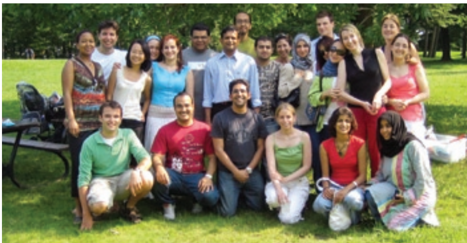
Les résidents de McGill s'en donnent à cœur joie au pique-nique des résidents.