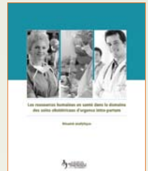
Sondage sur les ressources humaines en santé

D'autres initiatives ont aussi été entreprises afin d'améliorer les connaissances et la compréhension au sein de l'ensemble de la communauté médicale : des articles sont parus dans le Journal d'obstétrique et gynécologie du Canada (JOGC), et un rapport spécial a été publié. La première initiative consistait en la rédaction, aux fins de publication dans différents numéros de l'édition 2008 du JOGC, de deux articles traitant de l'expérience et