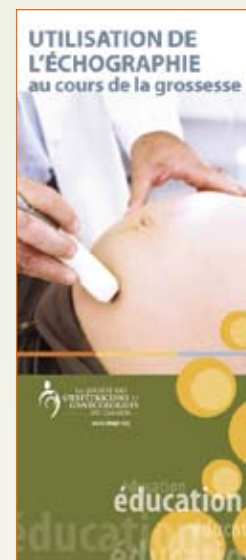
L'échographie au cours de la grossesse

L'objectif de ce programme est de sensibiliser le public, d'influencer les attitudes et de modifier les comportements en ce qui a trait au recours à la contraception en vue de prévenir les grossesses imprévues et la propagation des infections transmissibles sexuellement. À cette fin, la SOGC a lancé, à l'automne 2007, une campagne publicitaire intitulée Mon quotient sexuel . Tout un éventail d'outils pédagogiques et d'articles promotionnels ont été produits.