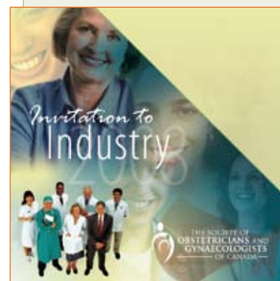
Sollicitation de soutien financier

De manière à améliorer l'efficacité et l'uniformité, la SOGC a dû clarifier et faciliter le processus d'élaboration des directives cliniques . À cette fin, la SOGC a défini et documenté les étapes nécessaires à l'élaboration et à la soumission de directives cliniques pour publication dans le Journal d'obstétrique et gynécologie du Canada (JOGC). Des définitions, des niveaux, des processus et des recommandations ont été établis. Il a également été décidé que les directives cliniques devaient être fondées sur les issues, c'est-à-dire qu'elles devaient être élaborées avec un objectif bien précis, en vue d'augmenter, de réduire, de créer ou d'éliminer une occurrence donnée. Par exemple, c'est avec fierté que, en 2007-2008, la SOGC a lancé le projet QUARISMA, dont l'objectif est de réduire les taux de césarienne au Québec. Ce programme a été élaboré en fonction de directives cliniques de la SOGC.