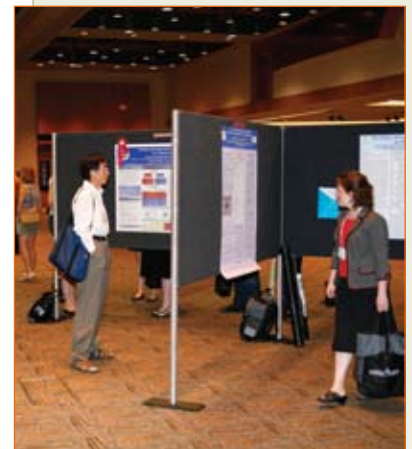
Prix recherche et innovation : Affiches portant sur l'obstétrique et la gynécologie

Étude rétrospective sur l'efficacité et la satisfaction de la stérilisation par hystéroscopie à l'aide de micro-implants de type Essure®