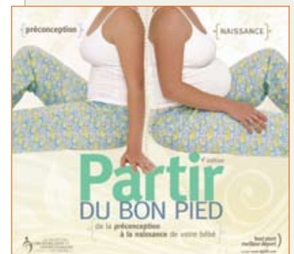
Partir du bon pied