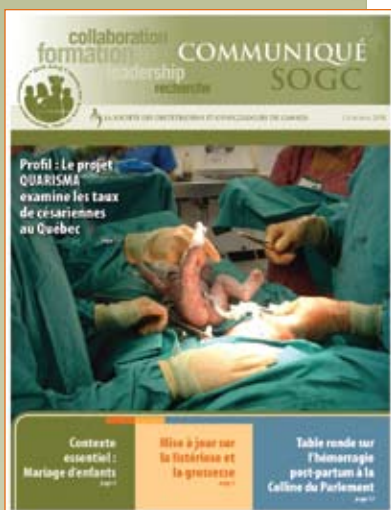
Communiqué de la SOGC

Les membres ont aussi continué de recevoir La Cigogne , communiqué électronique mensuel comportant une liste de coupures de couvertures pertinentes par les médias portant sur l'obstétrique-gynécologie.