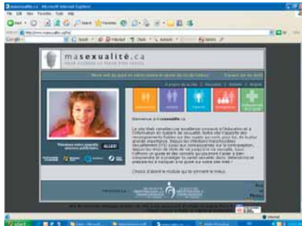
VISITES SUR LE SITE WEB 2003-2005